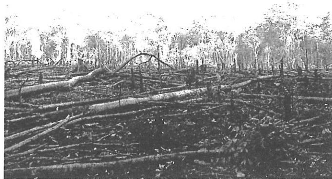
Figure B1 / Rajah B1