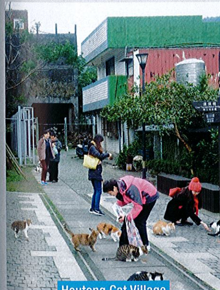
Houtong Cat Village

Daerah ini seringkali dibandingkan dengan Harajuku di Jepun kerana terdapat banyak kedai-kedai hip di sini. Pelbagai pilihan fesyen, hiburan dan tempat makan menjadi tarikan utama golongan remaja seperti kita.