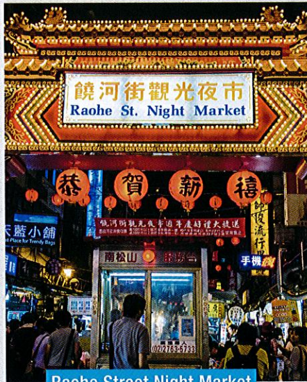
Raohe Street Night Market

Pasar sepanjang 600 meter ini dipenuhi dengan penjual sajian enak dan barangan mampu milik. Ia merupakan salah satu pasar malam tertua di Taipei. Kalau nak shopping baju dengan diskaun hebat, boleh terus ke Rangkaian Wufenpu yang terletak berhampiran.