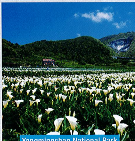
Yangmingshan National Park

Pekan ini merupakan kawasan perlombongan arang batu yang berakhir semasa kemerosotan industri tersebut pada tahun 90-an. Penduduk tempatan mula menjaga kucing terbiar yang ditinggalkan. Kemudian, ia dikenali sebagai perkampungan kucing. Siapa yang gila kucing wajib singgah okay!