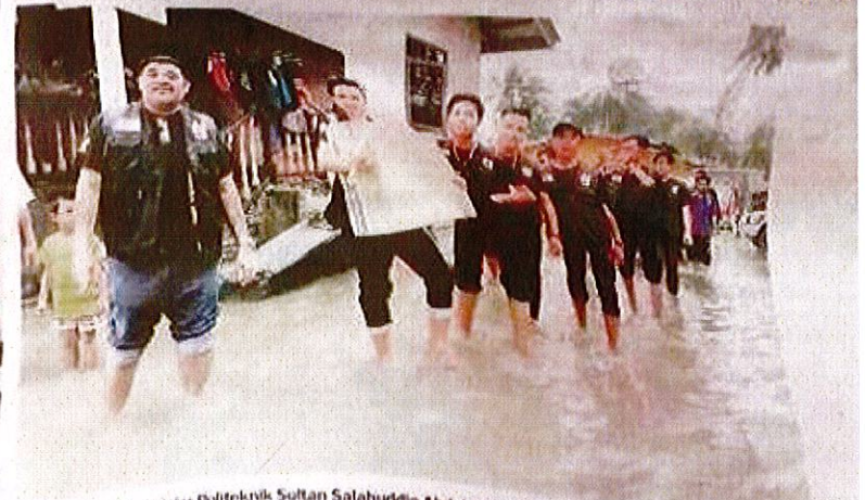
REDAH BANJIR Pelajar Politeknik Sultan Salahuddin Abdul Aziz Shah, Shah Alam yang merupakan sukarelawan YES Politeknik meredah banjir sambil membawa kanvas untuk disumbangkan kepada mangsa banjir.