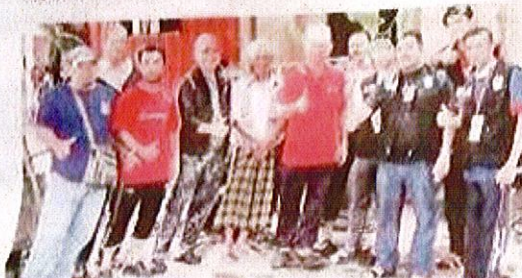
SIAP Mat Razi bersama pelajar Politeknik Sultan Salahuddin Abdul Aziz Shah, Shah Alam selepas kerja kerja pondawatan elektrik.