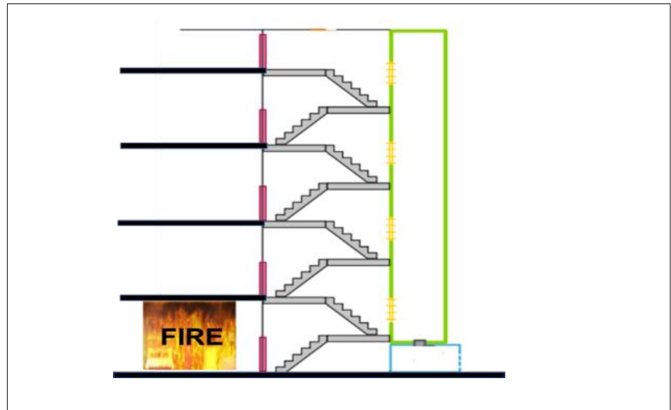
Figure B1(c) / Rajah B1(c)