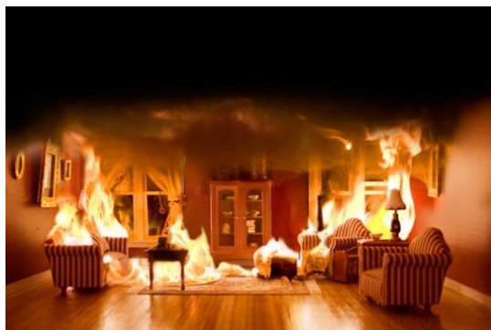
Figure 1(b) / Rajah 1(b)

Merujuk kepada Rajah 1(b), tafsirkan TIGA (3) kaedah yang boleh menyebabkan kebakaran merebak ke seluruh ruang bilik tersebut.