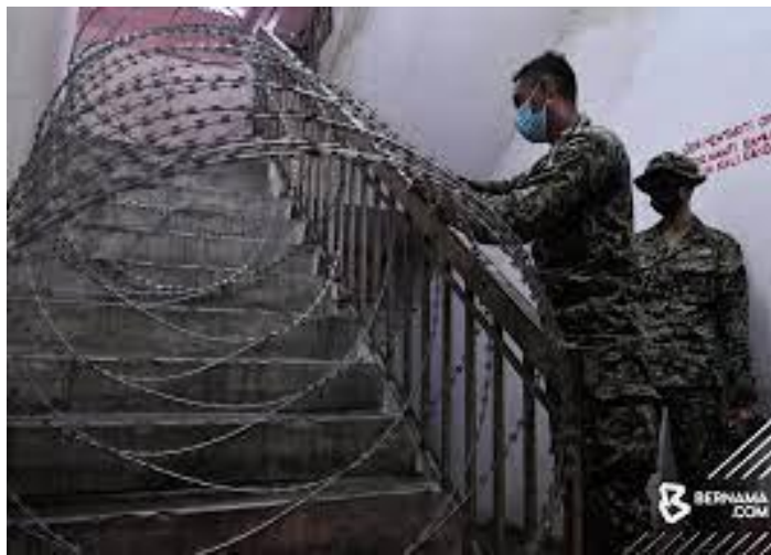
Figure 2(b) / Rajah 2(b)

Rajah 2(b) menunjukkan penempatan dawai berduri pada tangga di Blok C Projek Perumahan Rakyat (PPR) Kampung Baru Air Panas, di sini, diputuskan semasa mesyuarat penyelarasan Perintah Kawalan Pergerakan Diperketatkan (PKPD) yang bermula pada 3 Julai 2021.