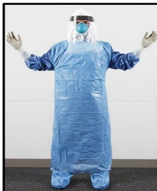
Rajah 2.4 Peralatan Perlindungan Diri (PPE)

SOP merupakan perkara utama yang ditekankan kepada pekerja pembersihan ketika ini kerana untuk mengelakkan dari virus covid-19 ini semakin merebak. Ditambah lagi kenyataan dari (Ishak, 2020) yang mengatakan bahawa ketika pandemik pemakaian peralatan perlindungan diri (PPE) merupakan perkara utama semasa melakukan kerja dikawasan covid-19 di hospital dan Malaysia sejak peringkat awal sistem penjagaan kesihatan awam telah berhadapan dengan kekurangan peralatan perlindungan diri (PPE). Kekurangan PPE bermakna petugas kebersihan juga akan menjadi terhad untuk melakukan kerja-kerja pembersihan kerana mereka perlu memakai PPE sebagai perlindungan diri dari dijangkiti covid-19. Pemakaian PPE juga merupakan prosedur operasi standard (SOP) yang telah ditetapkan kerajaan untuk melakukan kerja dikawasan covid-19 (KKM, 2020).