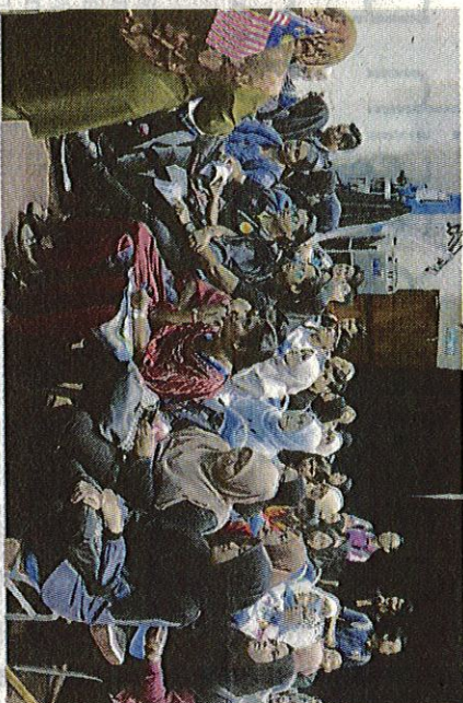
Antara aktiviti dianjurkan termasuk sesi ceramah.