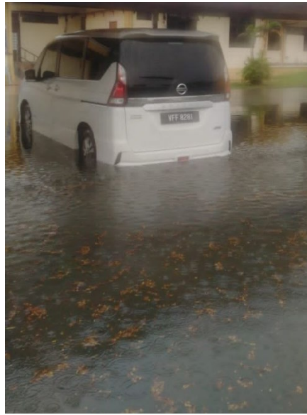
KERETA YANG DILETAKKAN DI TEMPAT LETAK KENDERAN JABATAN PERDANGANGAN