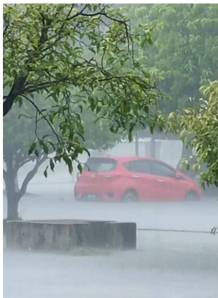
TEMPAT LETAK KENDERAN DI HADAPAN KAFETERIA